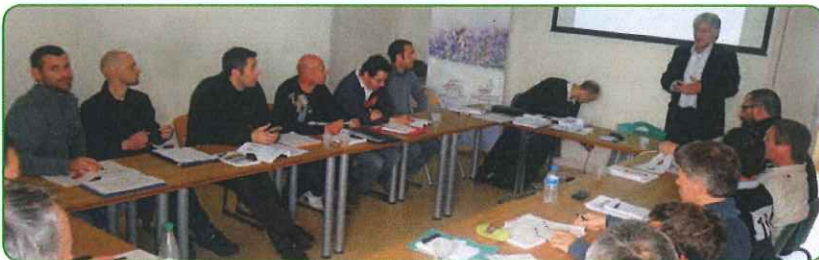
UN GROUPE D'ARTISANS EN "FORMATION INITIALE DORéMI"

Contact DORéMI : Basse Energie Biovallée Laure Charpentier : 04 75 25 43 82