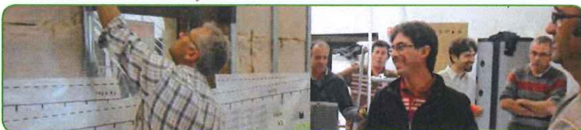
UN GROUPE D'ARTISANS EN "FORMATION PRATIQUE DORéMI" SUR MAQUETTE